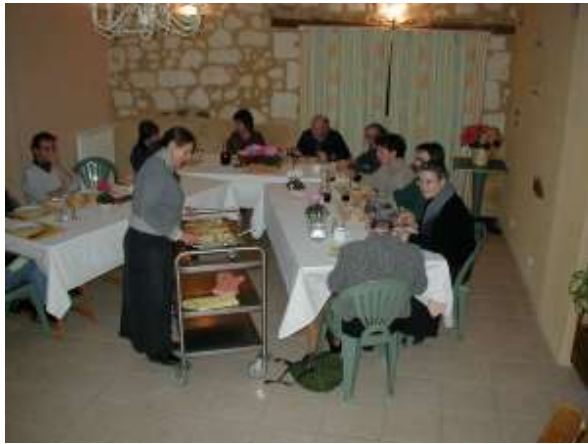
Transnationales Seminar vom 29.1. bis 3.2. 2003 in Sarthe (Frankreich)