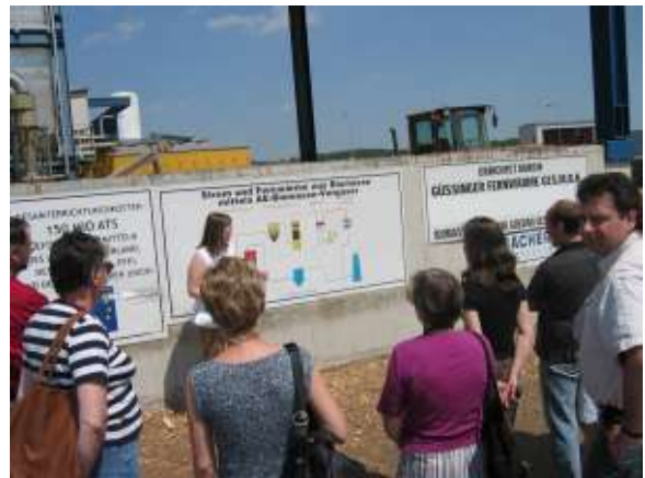
In Güssing im Biomasse-Kraftwerk