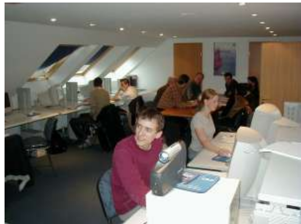
Die transnationalen Partner SCOP am 3.4. in Dessau beim TP Innobrain