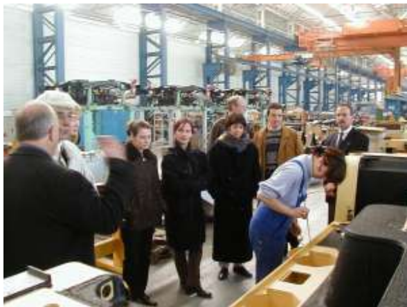
Die transnationalen Partner SCOP am 3.4. in Dessau bei der Fahrzeugtechnik