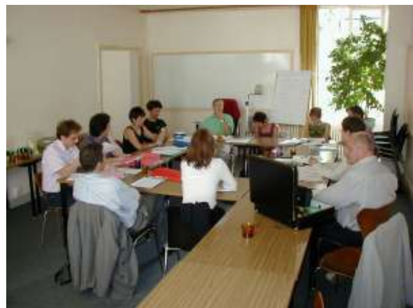
Transnationale Tagung mit SCOP und GREP in Paris am 27. und 28. Juni 2002