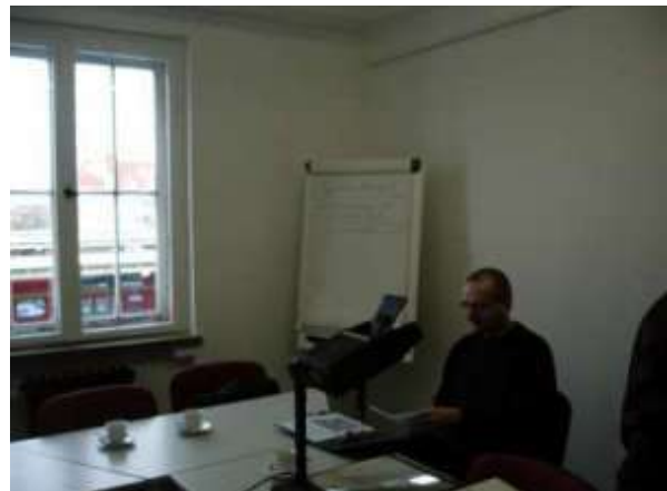
Workshop Gendermainstreaming am 26.01.2005