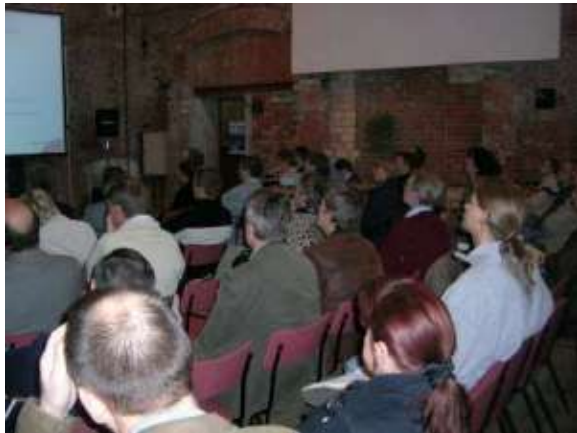
Zukunftsforum Open Source am 14.10.2004 in der Alten Brauerei