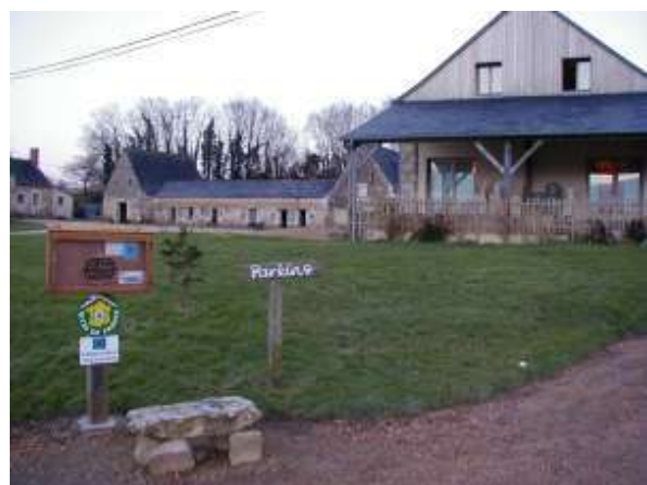
Transnationales Seminar vom 29.1. bis 3.2. 2003 in Sarthe (Frankreich)