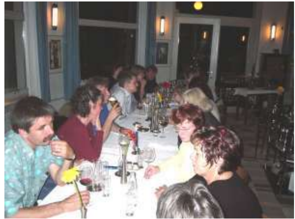
Der EQUAL Bundes-AK „Junge Menschen“ tagte vom 3. bis 5. Mai 2004 in Dessau