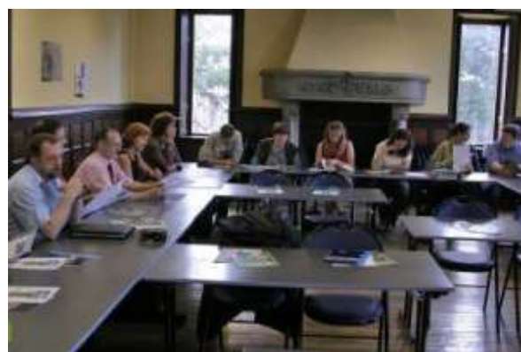
Bildungsreise nach Lyon, Grenoble und Autrans vom 10.07. bis zum 12.07.2003