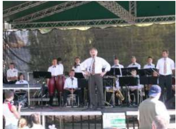
Tag der offenen Tür am 04.09.2004 mit Ministerpräsident Böhmer