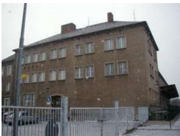
Das zukünftige Domizil der Anhalt Dessau AG am 02.02.2004