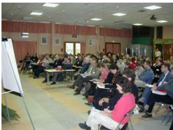
Tagung zur Regionalentwicklung in Annecy am 20./21. November 2002