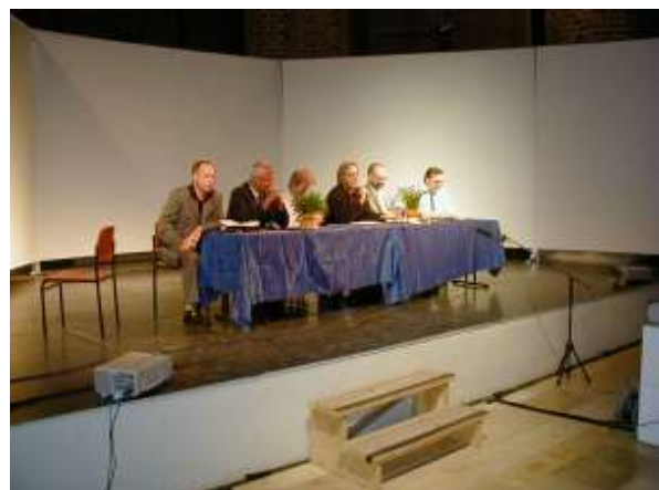
Podiumsveranstaltung mit der HS Anhalt in der Marienkirche am 13. August 2002