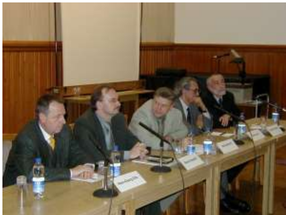
Podium am 28.11.2002 mit Staatssekretär Dr. Reiner Haseloff vom Wirtschafts- und Arbeitsministerium Sachsen Anhalt