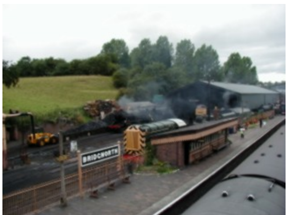
Bildungsreise nach Bridgnorth (GB) am 21.08.2003