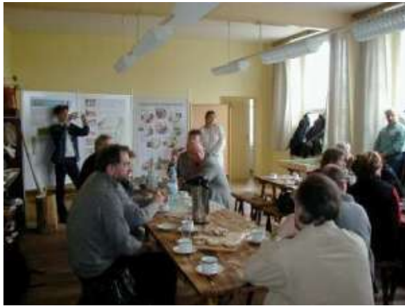
Bildungsreise nach Lauchhammer am 01.03.2004