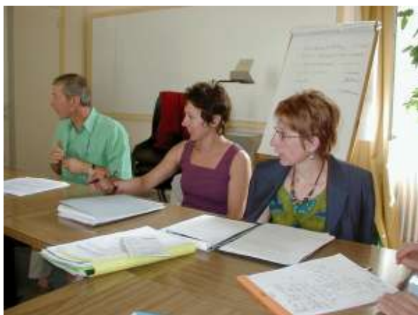
Transnationale Tagung mit SCOP und GREP in Paris am 27. und 28. Juni 2002