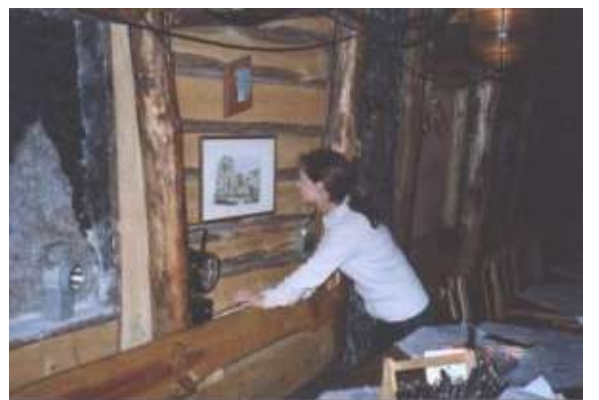
Die französischen Partner SCOP in Dessau, hier im Schacht Barbara in Gräfenhainichen am 21.04.2004