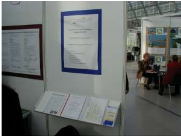
Messestand und Teilnahme auf der EURE-GIA in Leipzig vom 31.10. bis 02.11.2002