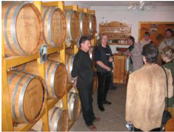
Besuch beim Waldviertel-Management am 22. und 23. 5. 2004 (Roggenhof, Destille)