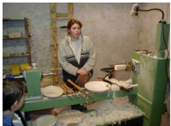
Besuch regionaler Genossenschaften in Rhone Alpes am 23./24. November 2002