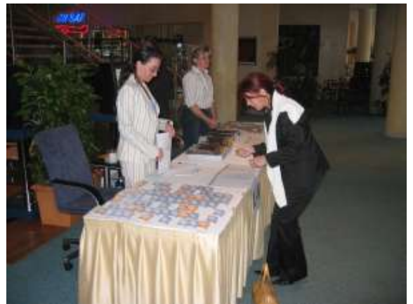
Zukunftsforum Alternative Finanzierung (ALFI) mit 204 Teilnehmern am 17.06.2004