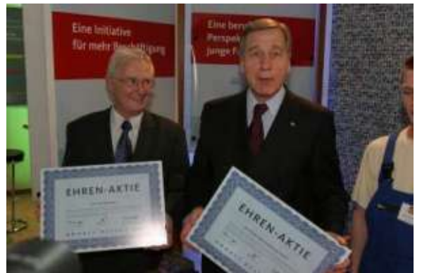
Teamarbeit Deutschland, Magdeburg 18.03.2004. Die Ehrenaktionäre der ADAG Dr. Horst Rehberger und Wolfgang Clement