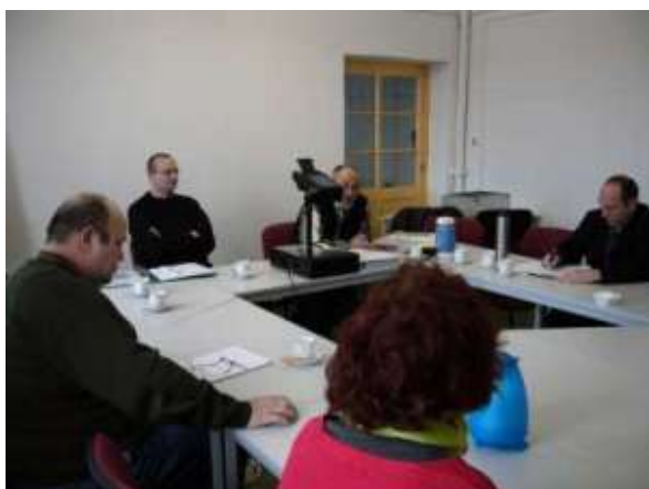
Workshop Mitarbeiterbeteiligung am 27.01.2005