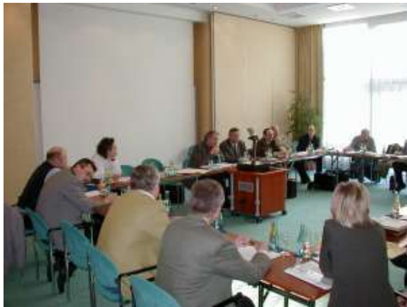
4. Mitgliederversammlung der EP „Initiative Dessau“ am 15. 3. 01 im Hotel Fürst Leopold