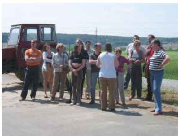
Besuch im Biomasse Fernwärmewerk Güssing am 22.05.2004