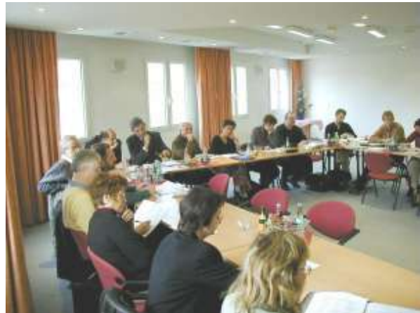
Kerngruppe am 19.11.2003 im Parkhotel