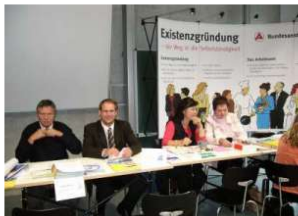
Existenzgründer-Beratung am 28.09.2004