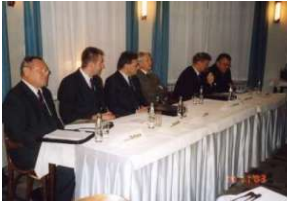
Mitgliederversammlung der Initiative Dessau am 13.11.2003 im Kornhaus