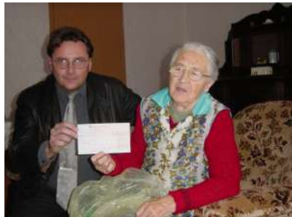
Überreichung eines Schecks der Initiative Dessau aus den gesammelten Spenden für die Opfer des Hochwassers im Jahr 2002