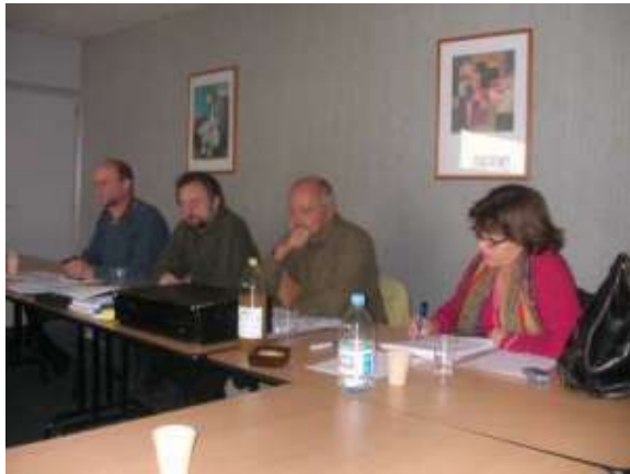
Arbeitsbesuch in Lyon am 05.07.2004