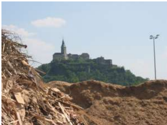
Bildungsreise nach Güssing am 23.05.2004