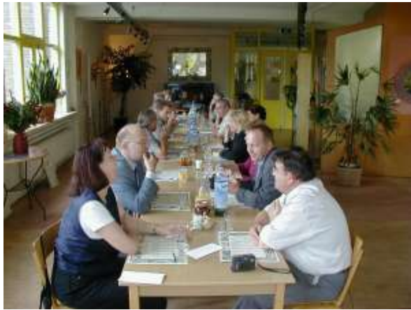
Bildungsreise Amsterdam (Jugendprojekte) vom 5. bis 6. 9. 2002