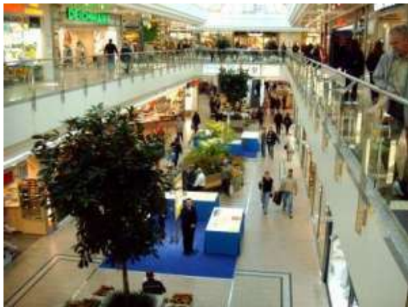
Dessauer Lernmarkt im Rathauscenter am 30.10.2004