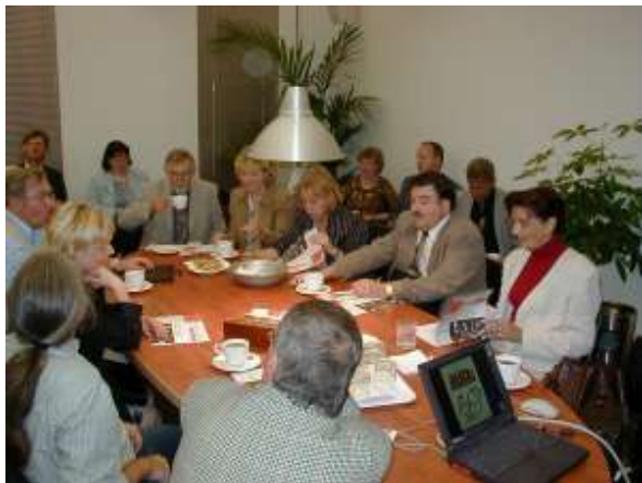
Bildungsreise Amsterdam (Besuch im Megabanenmarkt) vom 5. bis 6. 9. 2002