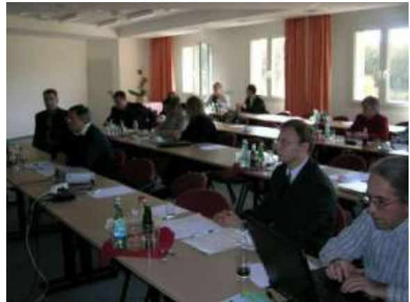
Workshop Duale Beschäftigungsfähigkeit im Parkhotel am 22.10.2004