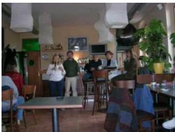
SCOP Besuch im Gründerinnenzentrum in Dessau am 25.09.2004