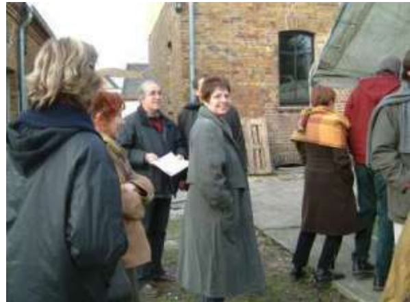
Französische Partner GREP in Dessau, hier am 02.03.2004 im Buchdorf