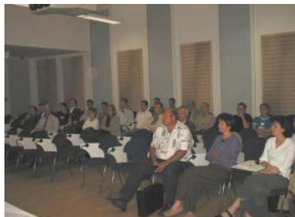
Öffentliche Präsentation des TP Innobrain am 25. September 2003 im TGZ Köthen