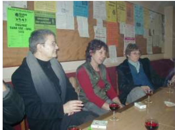
Transnationales Seminar vom 29.1. bis 3.2. 2003 in Sarthe (Frankreich)