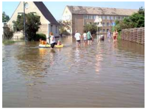
Aufruf der EP „Hilfe für Dessau“ für die Opfer des Elbe-Hochwasser im August 2002