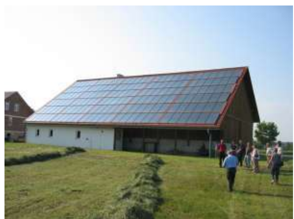
Der „Energie-Stadl“ in Urbersdorf am 23.05.2004