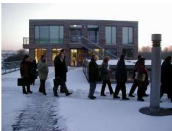
Bildungsreise zum Besuch der Wolfsburg AG am 9. und 10.01.2003