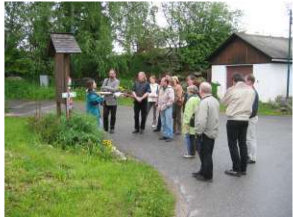
Besuch beim Waldviertel-Management am 22. und 23. 5. 2004 (Mohndorf)